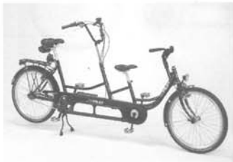
COPILOT 24 , kleine uitvoering