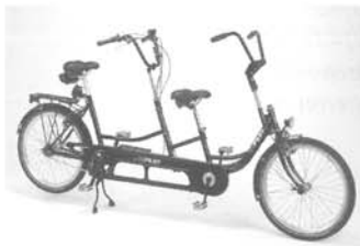
COPILOT 24 , grote uitvoering