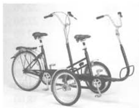
COPILOT 3 MATURE